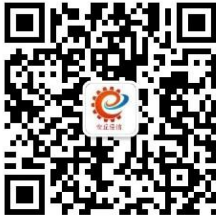
图 2 原经信局微信公众号二维码