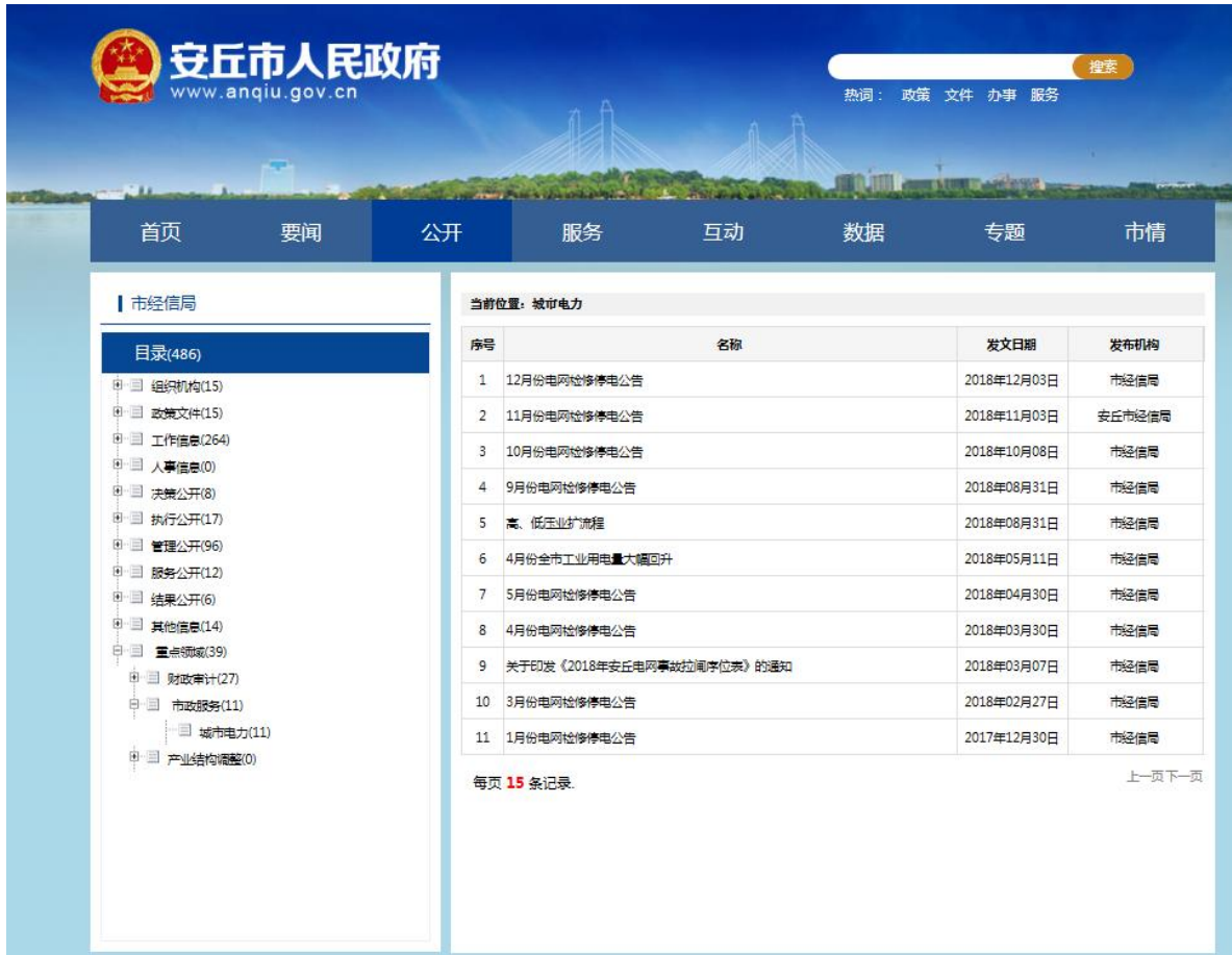
图 3 原经信局重点领域信息公开情况