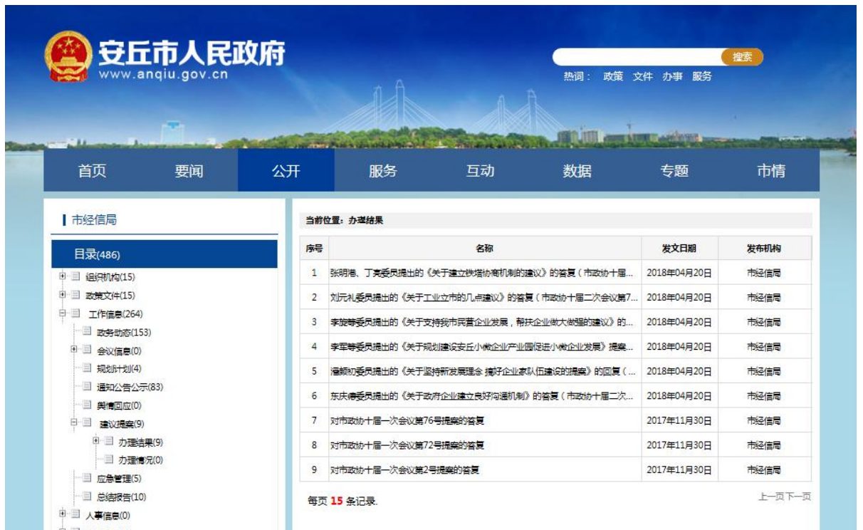
图 5 原经信局建议提案办理结果公开情况