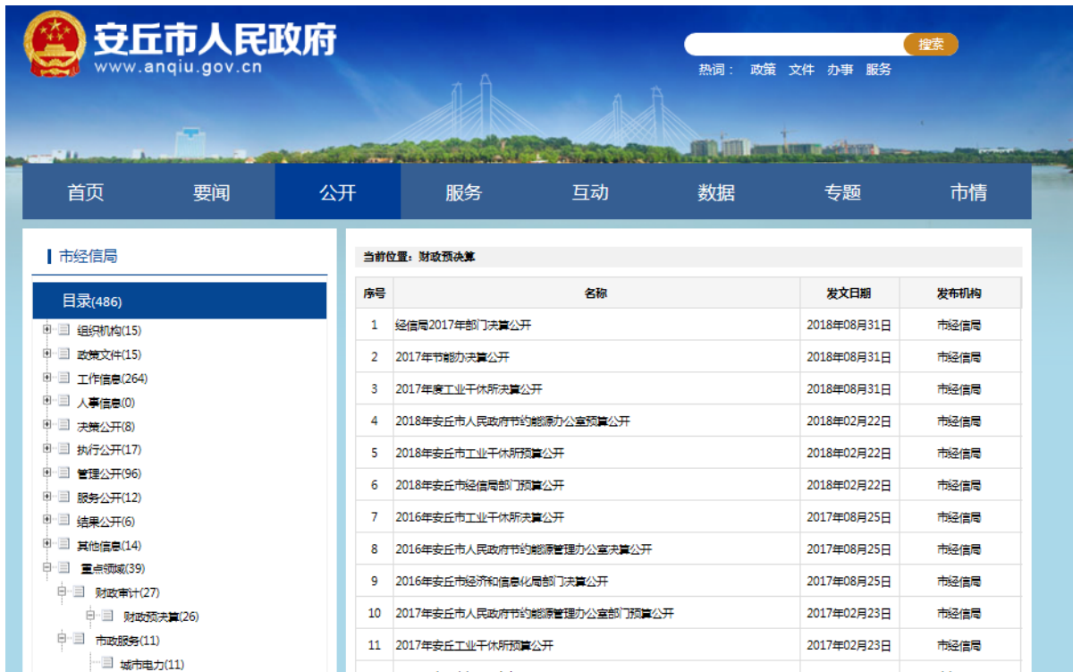
图 4 原经信局财政预算公开情况